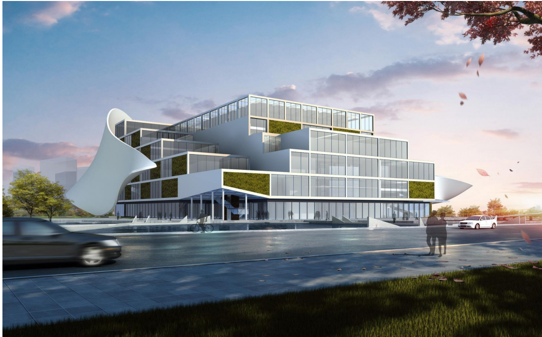
Зала за електронни спортове – Чънду, Китай, арх. М. Керемидски