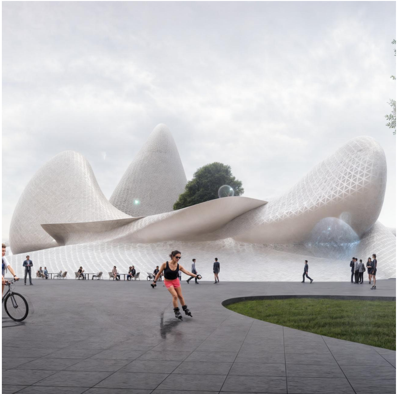
Галерия на изкуствата в Ченду, Китай, арх. М. Керемидски